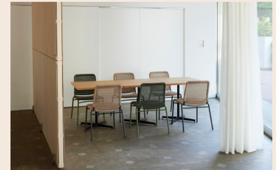
ミーティングスペース