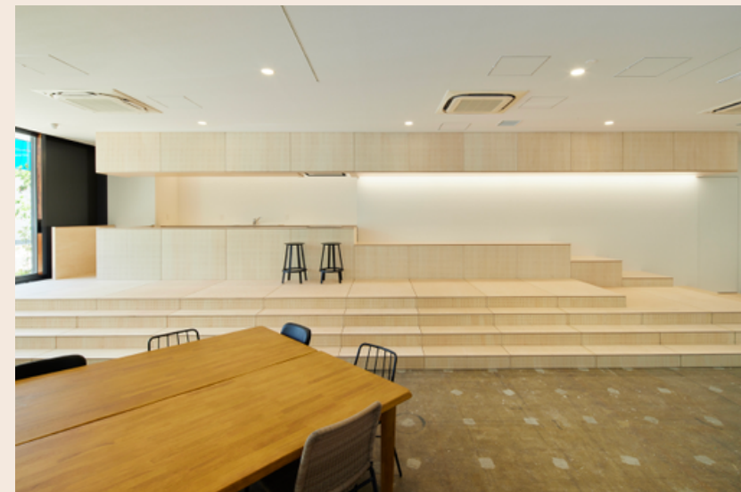
室内からチャットカウンター (キッチン)を見た時