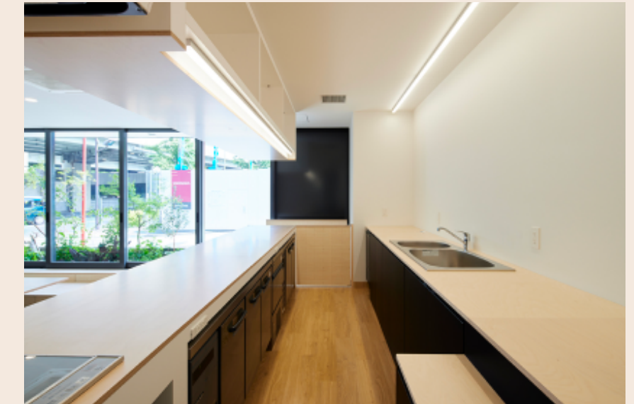
チャットカウンター(キッチン)