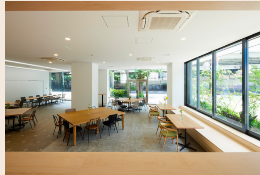
入り口から室内を見た時